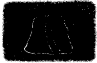
i 発掘された窯跡（黒炭用）

古来より、須玉町内では炭焼きが行なわれており、最近の発掘調査でも古い窯跡が多く発見されています。